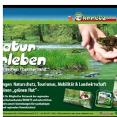
VEREIN ÖKONETZ STEIERMARK-SÜD (Ökonetz Steiermark Süd)

Kronnersdorf 72 8345 Straden M. +43 (0)664 / 84 18 338 http://www.oekonetz.com