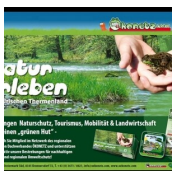
VEREIN ÖKONETZ STEIERMARK-SÜD (Ökonetz Steiermark Süd)

Kronnersdorf 72 8345 Straden M. +43 (0)664 / 84 18 338 http://www.oekonetz.com