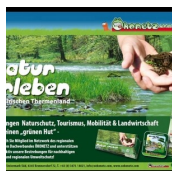
VEREIN ÖKONETZ STEIERMARK-SÜD (Ökonetz Steiermark Süd)

Kronnersdorf 72 8345 Straden M. +43 (0)664 / 84 18 338 http://www.oekonetz.com