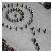
MARKTMUSIKKAPELLE STRADEN (Marktmusikkapelle Straden)

Straden 98 8345 Straden T. +43 (0)664 / 82 52 521 http://www.marktmusik-straden.at