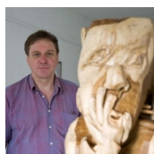
GALERIE LEBENSWELTEN (Johnny Fortmüller)

Radochen 11 8484 Straden M. +43 (0)664 / 27 44 071 http://www.johnny-fortmueller.at