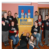
BÜCHEREI IM MESSNERHAUS (BIM Bücherei im Messnerhaus)

Straden 60 8345 Straden T. +43 (0)3473 / 20 0 20 http://www.bim-straden.bvoe.at