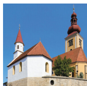
PFARRAMT STRADEN (Pfarramt Straden)

Straden 1 8345 Straden T. +43 (0)3473 / 8208 http://straden.graz-seckau.at/