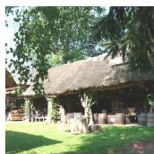
NOSTALGISCHES LANDLEBEN (Familie Wiedner)

Straden 98 8345 Straden T. +43 (0)664 / 82 52 521 http://www.marktmusik-straden.at