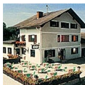
GRILL- UND BACKHENDLSTATION HESCH (Familie Hesch)

De Merin ist das Beste vom Land, handverlesen, zu Genüssen komponiert.