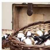
GREISLEREI DE MERIN (Greißlerei De Merin)

Straden 5 8345 Straden T. +43 (0)3473 / 75 9 57 http://www.demerin.at