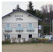
TANKSTELLE GASTHAUS RÖCK (Gert Röck)

Radochen 61 8484 Straden T. +43 (0)3475 / 2333 M. +43 (0)664 160 36 87 http://www.roeck.biz