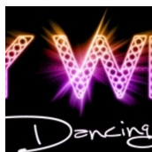
DISKOTHEK & PIZZERIA KEY WEST (Dieter Pock)

Markt 51 8345 Straden T. +43 (0)3473 / 75 963 M. +43 (0)664 / 21 37 040 http://www.key-west.at