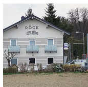
TANKSTELLE GASTHAUS RÖCK (Gert Röck)

Radochen 61 8484 Straden T. +43 (0)3475 / 2333 M. +43 (0)664 160 36 87 http://www.roeck.biz