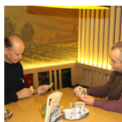
DIE KLAUSEN - CAFE & BAR (Marika Hirtl)

Wieden-Klausen 35 8345 Straden T. +43 (0)3473 / 8254 http://www.bund.at